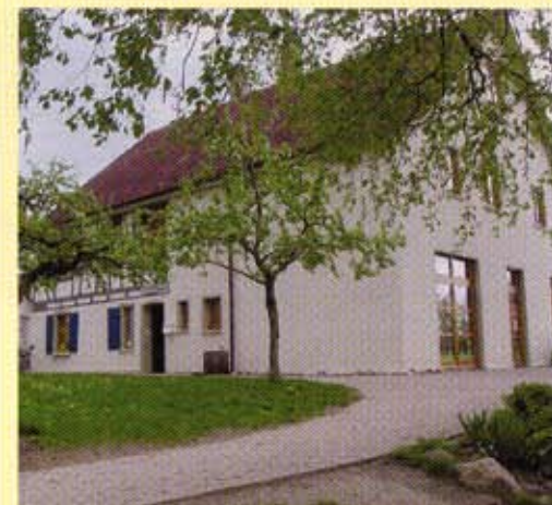
des katholischen Kindergartens St. Elisabeth Ebersbach-Musbach